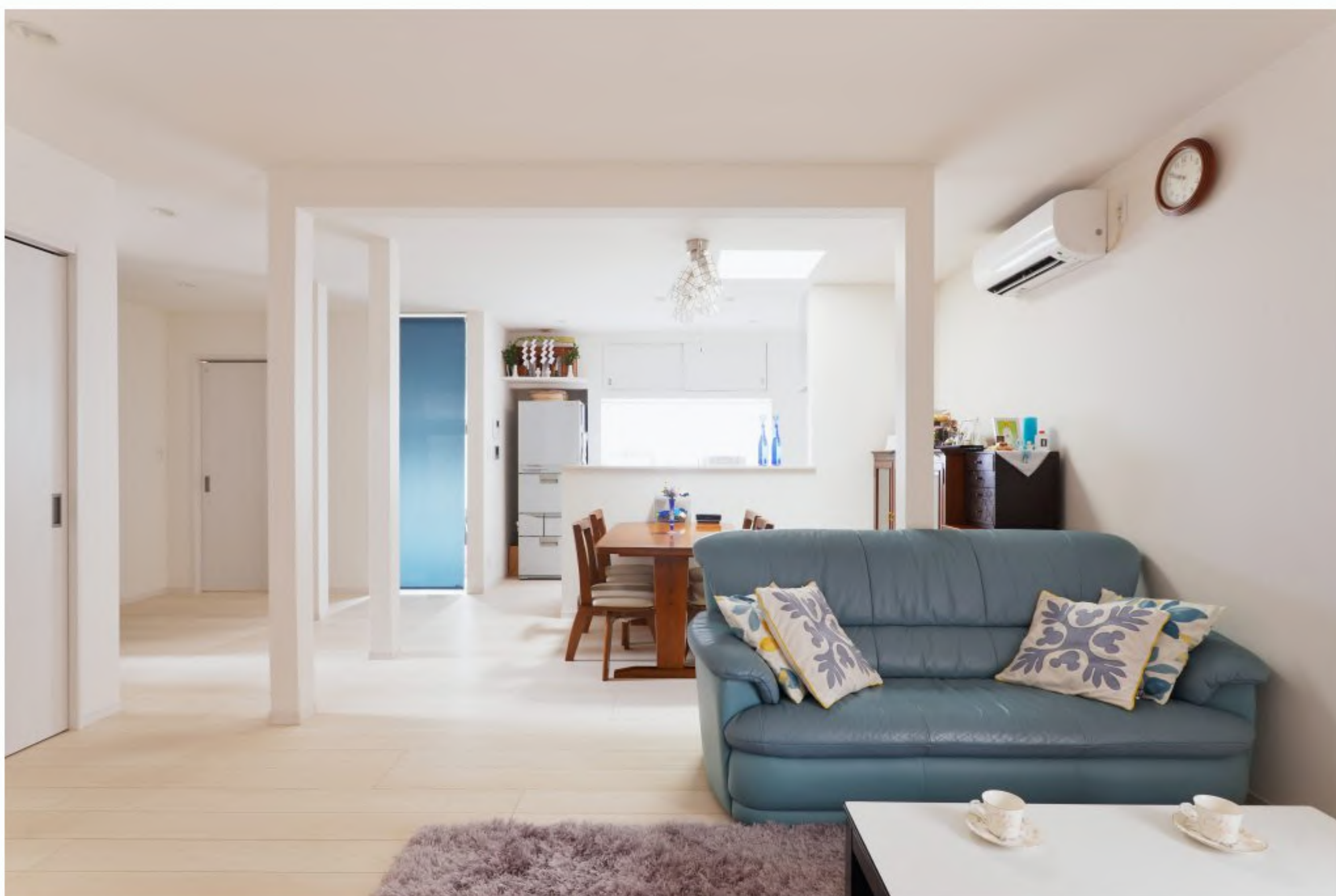
リビング：全体的に白で統一