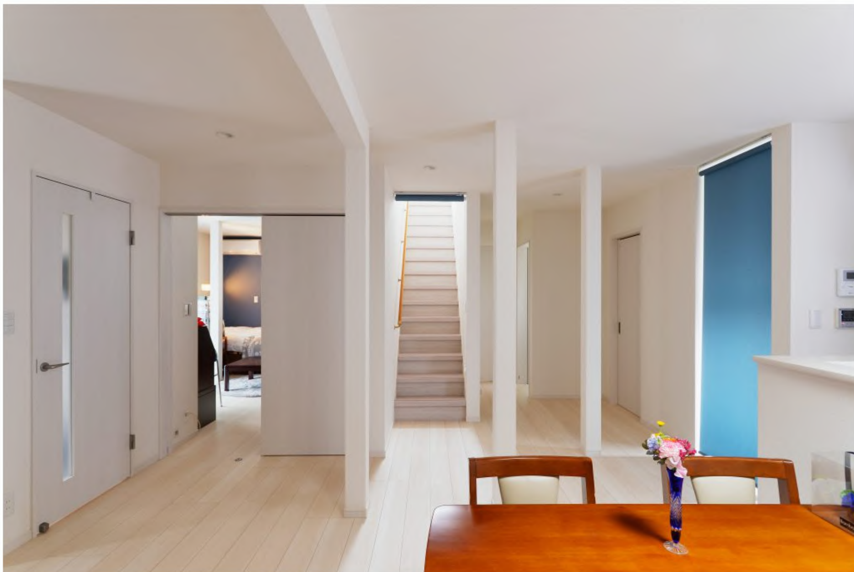
リビング：リビングでくつろいだあとはすぐに寝室へ