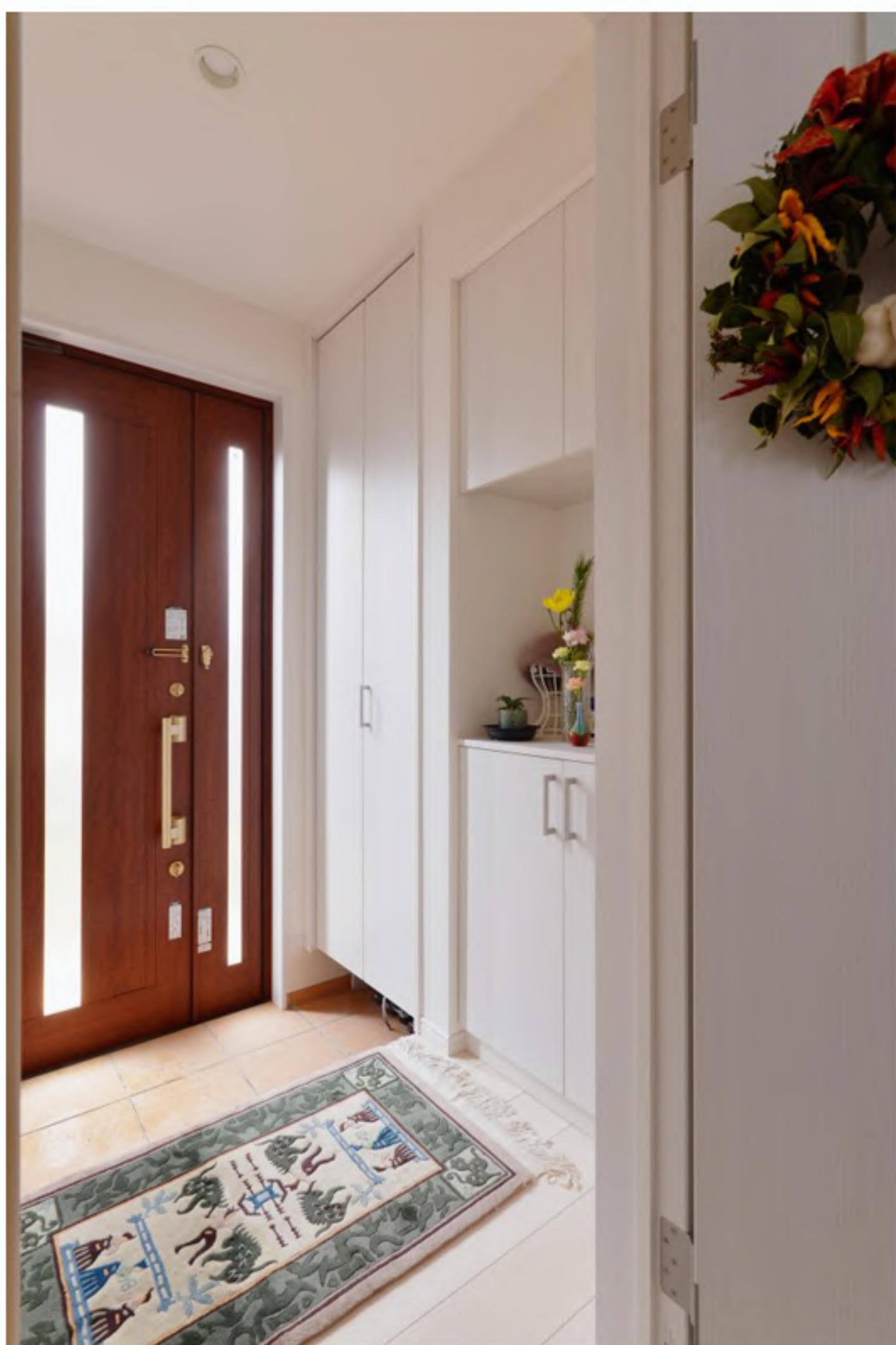
玄関：移設した玄関。収納たっぷりです