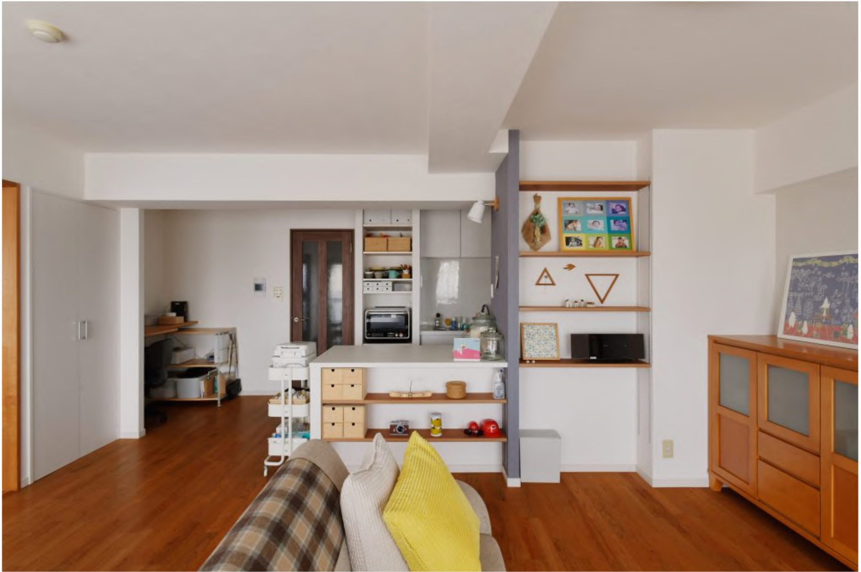
リビングダイニングキッチン：閉鎖的になりがちな壁付けのキッチンをダイニング側に調理カウンターをすることで対面キッチンのように使うことができます