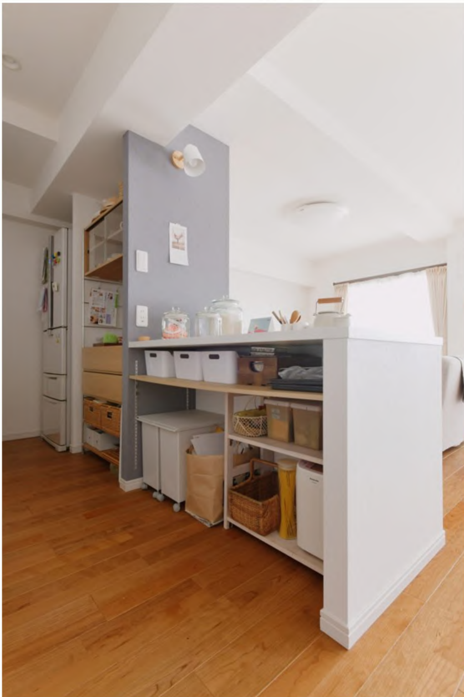
調理カウンター：お客様の身長や調理器具に合わせ、調理カウンターや下の収納を設計しました