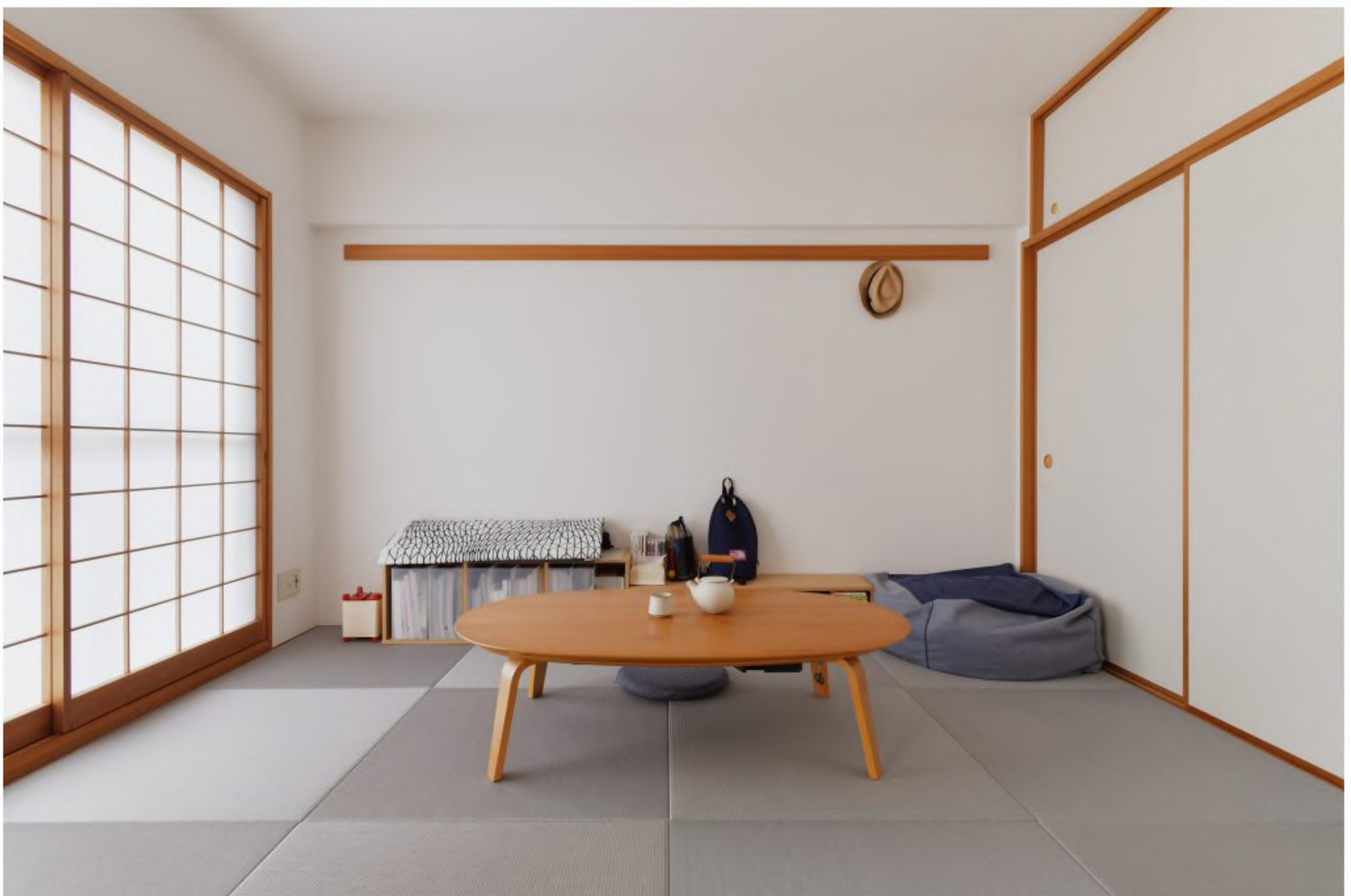
和室：畳スペースをあえて残すことで、居心地のいいお昼寝スペースになりました