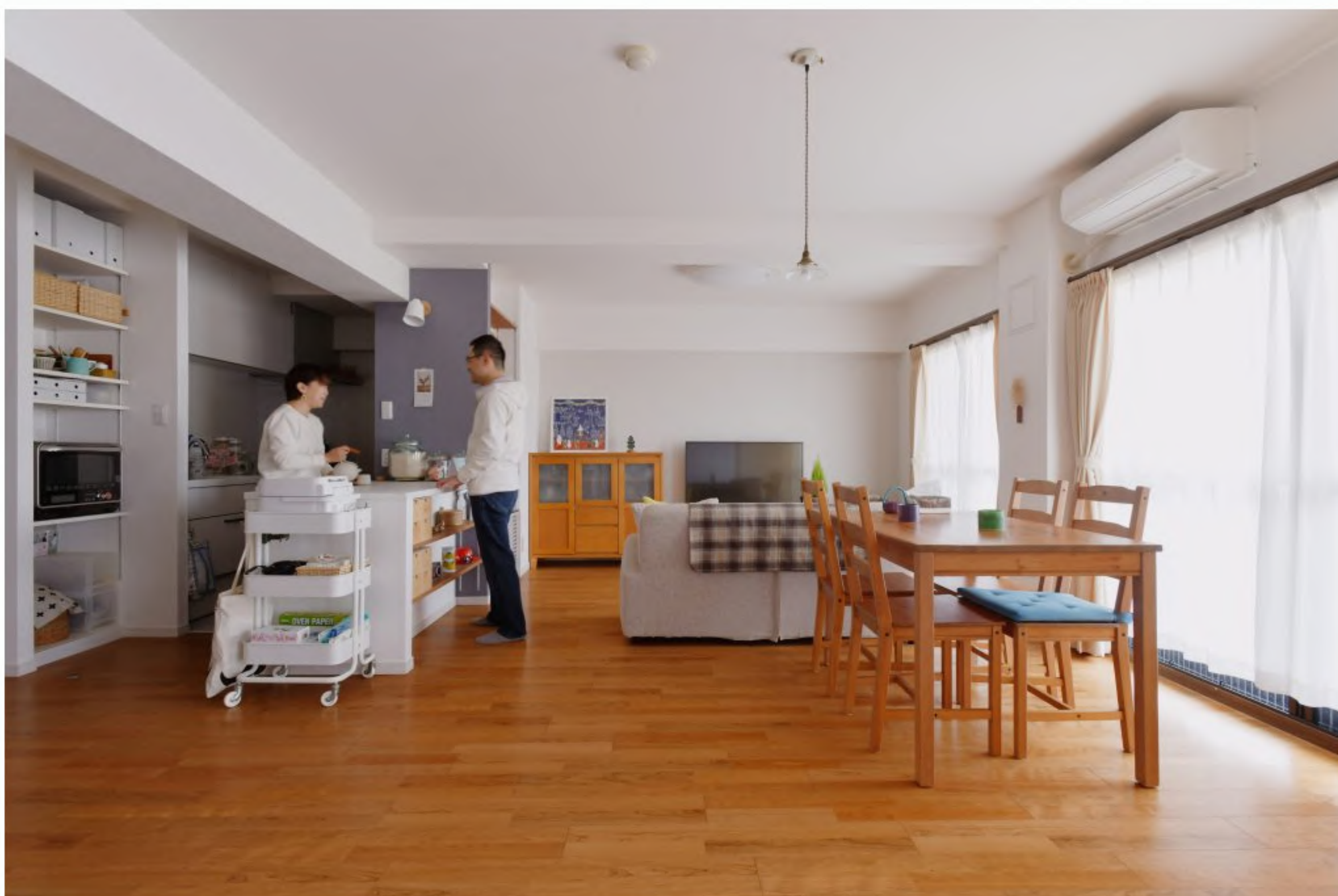
リビングダイニングキッチン