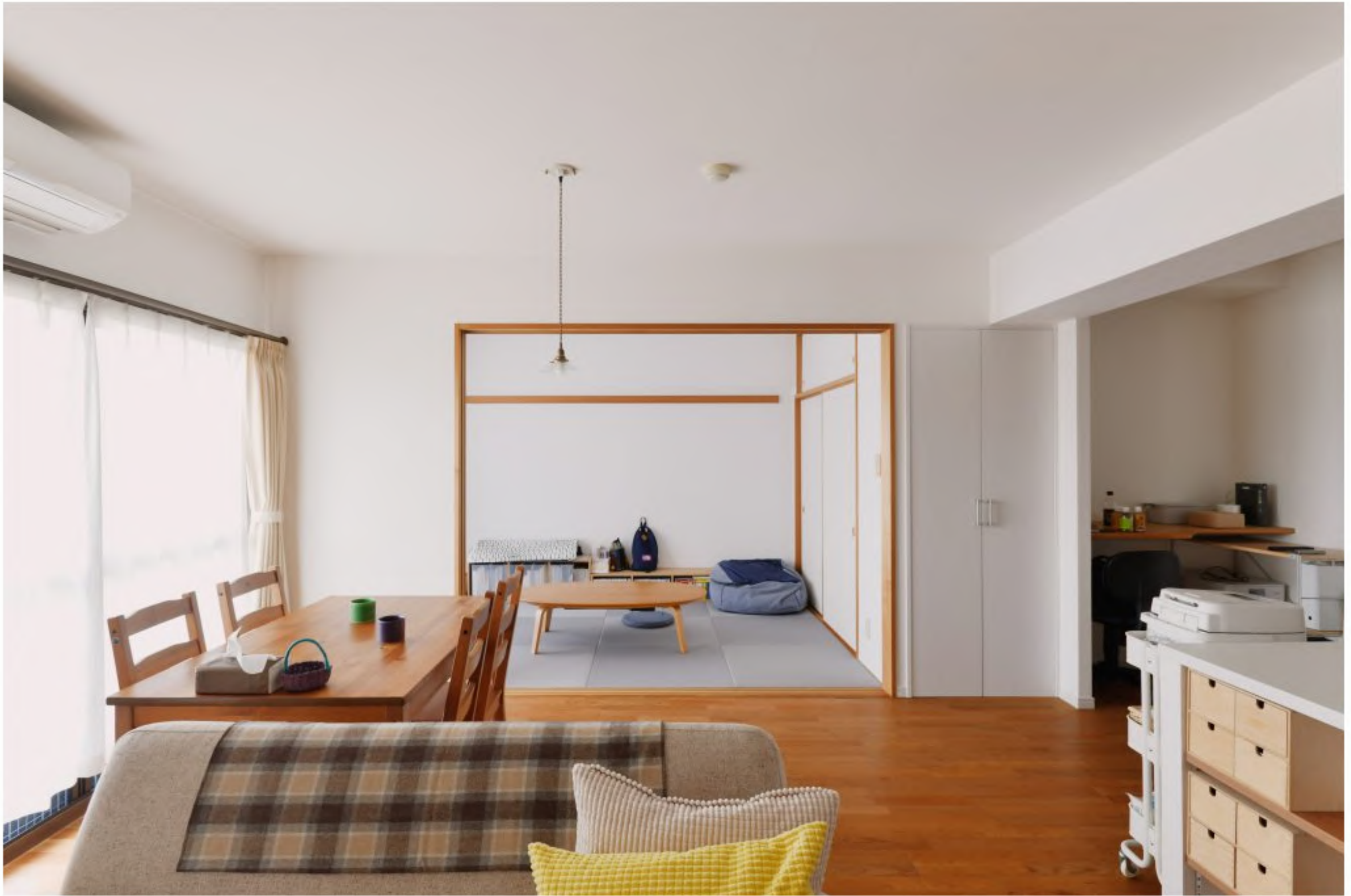
ダイニング～和室：洋室のインテリアにも馴染む縁なしのカラー畳を採用しました