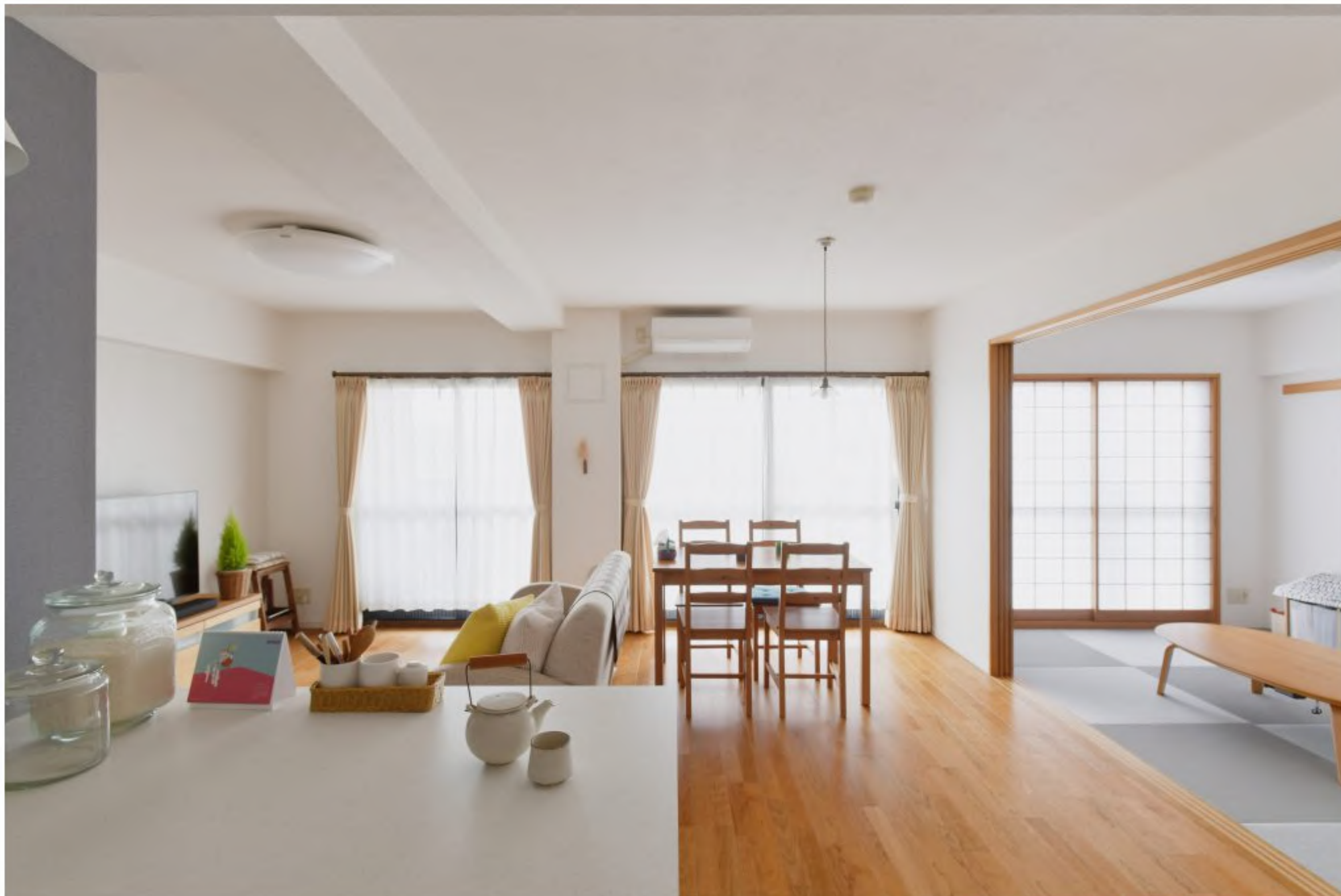
リビングダイニングキッチン